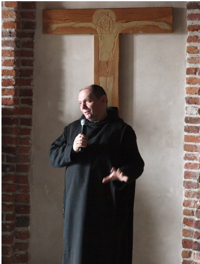
Zakończenie rekolekcji wielkopostnych w Tyńcu w 2012 roku.