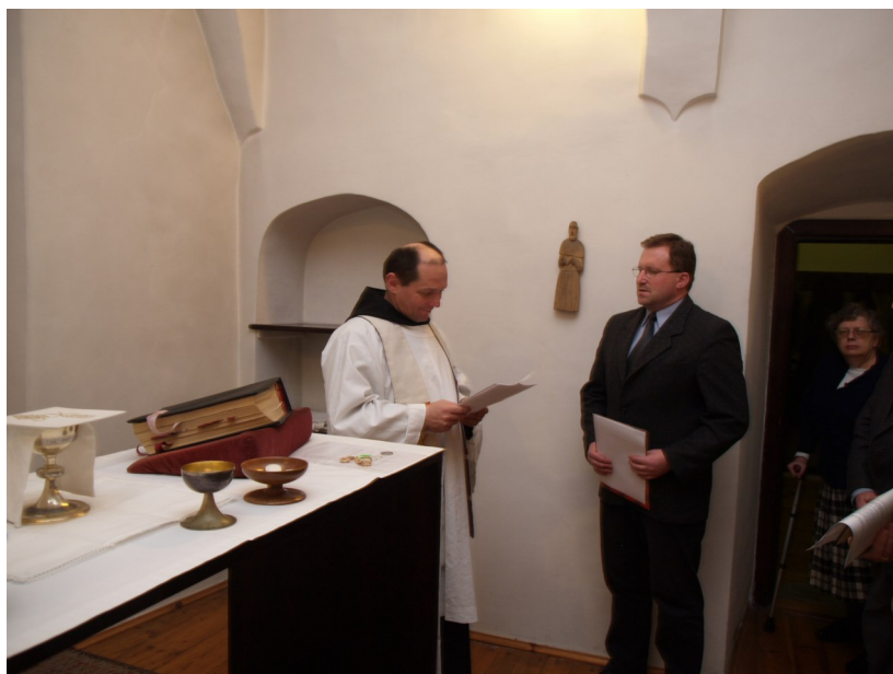
Powyżej przyjęcie do nowicjatu w Kaplicy na Opatówce w grudniu 2005 r.

Po napisaniu odpowiedniej prośby i przekazaniu jej na ręce ojca, z czasem, okazało się, że jednak jest to możliwe!